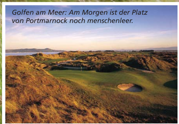
Golfen am Meer: Am Morgen ist der Platz von Portmarnock noch menschenleer.