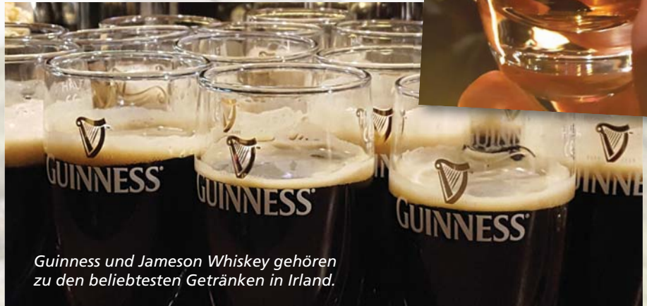
Guinness und Jameson Whiskey gehören zu den beliebtesten Getränken in Irland.

Limerick hat einen furchtbar schlechten Ruf. Wieder ist ein Buch nicht ganz un-