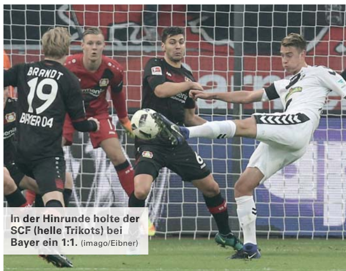
In der Hinrunde holte der SCF (helle Trikots) bei Bayer ein 1:1.