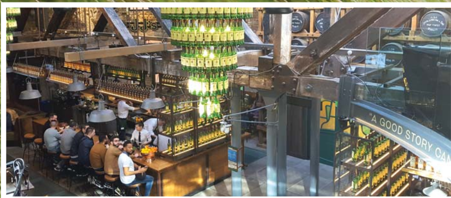
Leuchtendes Beispiel: Die Jameson Distillery schickt ihre Besucher auf eine Erlebnisreise rund um den Whiskey.

Bücher gibt es auch im „Little Museum of Dublin“. Aber nicht nur. Für mich ist das