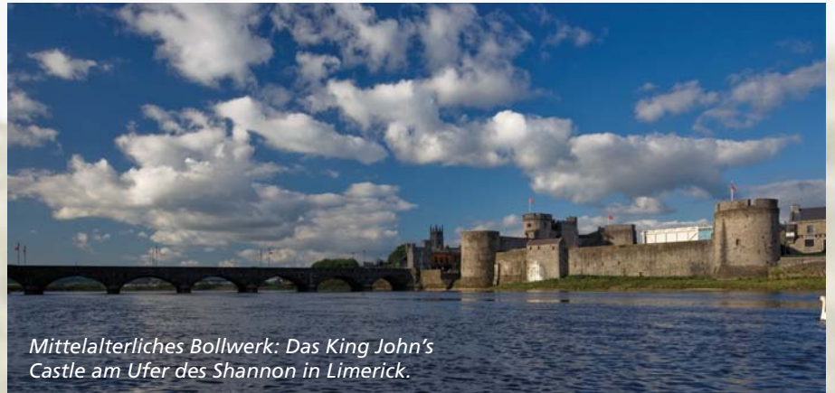
Mittelalterliches Bollwerk: Das King John's Castle am Ufer des Shannon in Limerick.

Die Jameson Distillery eröffnete erst Anfang März 2017 neu. Von den Decken des 1780 gegründeten Unternehmens hängen schwere Lüster aus leeren Whis-