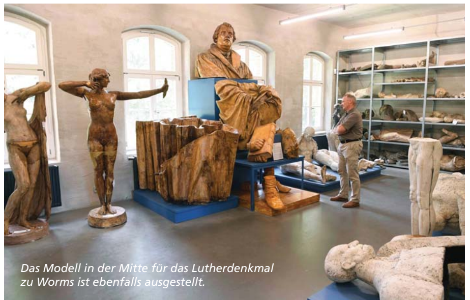
Das Modell in der Mitte für das Lutherdenkmal zu Worms ist ebenfalls ausgestellt.

D er Modellfundus der Gießerei bildet heute den einzigartigen Grundstock der Sammlung des Museums. In einem der größten Räume, dem Schaudapot, stehen Nachbildungen historischer Persönlichkeiten gleich neben anmutigen Schönheiten, es sind die Konterfeis von Schiller, Dante, Müntzer, Marx und anderen historischen Persönlichkeiten ebenso zu finden wie Venus und Aphrodite, aber auch Nachbildungen von Rehen, kämpfenden Elefanten oder Löwen. Die etwa 2.800 Objekte stehen als geschlossenes Konvolut unter Denkmalschutz. Eine derartige Modell-