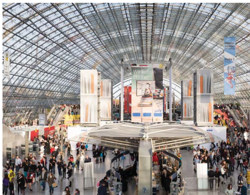
Buchmesse 2017

Die Leipziger Buchmesse ist der wichtigste Frühjahrestreff der Buch- und Medienbranche und versteht sich als Messe für Leser, Autoren und Verlage. Sie präsentiert die Neuerscheinungen des Frühjahrs, aktuelle Themen und Trends. Das Motto lautet: vier Tage lang eintauchen in die faszinierende Welt der Literatur und spannende Neuerscheinungen, Autoren, Programme und Verlage entdecken - hier können Autorinnen und Autoren aus der Nähe erlebt werden.