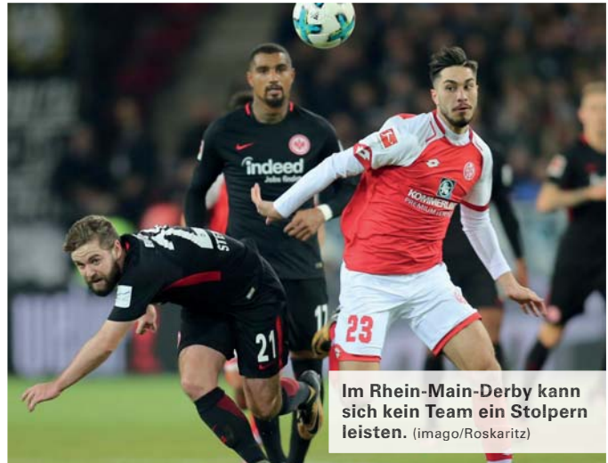
Im Rhein-Main-Derby kann sich kein Team ein Stolpern leisten.