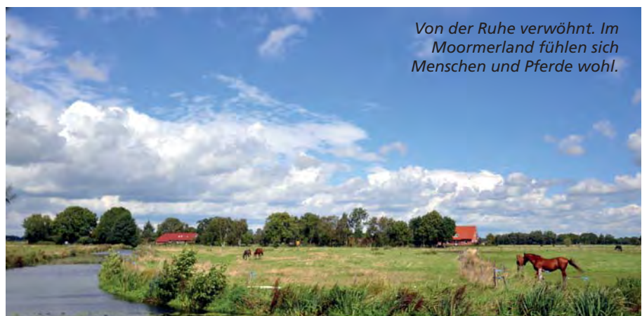
Von der Ruhe verwöhnt. Im Moormerland fühlen sich Menschen und Pferde wohl.

Tourist-Information Moormerland Dr.-Warsing-Straße 79 26802 Moormerland Tel.: 04954 801250-0 E-Mail: info@moormerland-tourismus.de