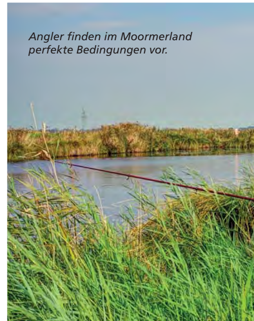
Angler finden im Moormerland perfekte Bedingungen vor.

Im Moormerland leben rund 23.000 Menschen. Die ostfriesischen Städte Emden, Aurich und Leer rahmen die Landgemeinde ein. Im Südwesten fließt die Ems. Urlauber schätzen die Wasser- und Radwege, die den Landstrich wie ein feines Netz durchziehen. Insgesamt gibt es acht Radrouten, die an allen Sehenswürdigkeiten vorbeiführen. In unmittelbarer Nähe verlaufen auch die Fehnroute, ein 165 Kilometer langer Radfernweg sowie der Friesische Heerweg aus dem 8. Jahrhundert.