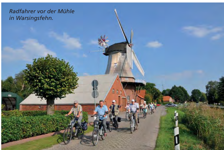
Radfahrer vor der Mühle in Warsingsfehn.

Mit nordischer Gemütlichkeit auf kleinem Raum punktet das 1.500-Einwohner-Dörfchen Oldersum. Dank der Religionsgespräche im Jahr 1526 gilt der Flecken als Wiege der ostfriesischen Reformation. Zu kleinen Attraktionen haben sich bei Urlaubern die Alte Waage, der heimelige Hafen und das Schöpfwerk gemauert. Mit einer Leistung von 30.000 Litern Wasser pro Sekunde war es einst das größte seiner Art und sorg-