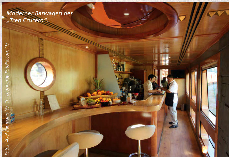
Moderner Barwagen des „Tren Crucero“.

ten rot-schwarzen Waggons gespannt. 2012 wurden sie in Europa gebaut. Der „Tren Crucero“ ist zwar ein Luxuszug, aber kein Orient-Express. Maximal 54 Passagiere nimmt er mit auf eine Zeitreise durch die ecuadorianische Geschichte und Gegenwart. Da der Mann am Klavier fehlt, klingt „El Condor Pasa“ aus dem Bordlautsprecher. Jahrelang gab es keine durchgehenden Züge mehr auf der 450 Kilometer langen schmalspurigen Route. „Für 280 Millionen US-Dollar ließ Präsident Rafael Correa die Strecke als Prestigeobjekt für den Tourismus restaurieren“, informiert Maria Parra: „Einheimische können sich den Zug leider nicht leisten. Sie fahren die gleiche Tour lieber für ein paar Dollar in acht Stunden mit dem Bus.“