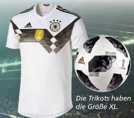
Die Trikots haben die Größe XL.