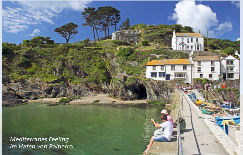
Mediterranes Feeling im Hafen von Polperro.

Eine Reise durch Cornwall ist vielfach eine Rolle rückwärts durch die Zeit. Es