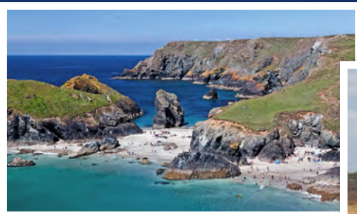
Cornwall-Vielfalt: Exotisches Pflanzenparadies Trebah Garden (li.), Kynance Cove bei Lizard Point (Mi.) und Besuch bei Dreharbeiten zu einem Pilcher-Film (re.).