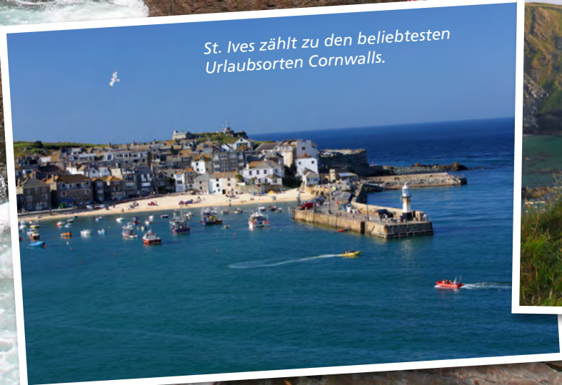
St. Ives zählt zu den beliebtesten Urlaubsorten Cornwalls.