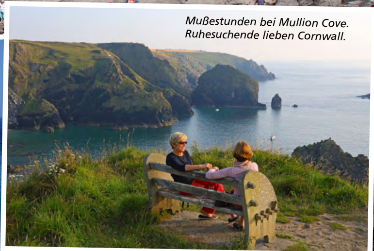
Mußestunden bei Mullion Cove. Ruhesuchende lieben Cornwall.