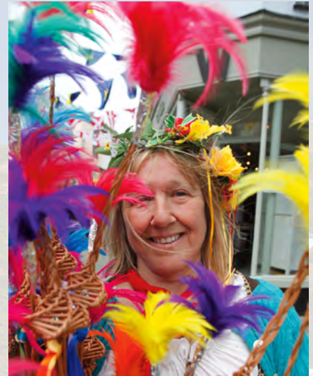
Ticklestickverkäuferin in Port Isaac.

Wichtige Termine im Veranstaltungskalender sind die Auftritte im Minack Theatre, der Maitanz von Obby Oss in Padstow und die regelmäßig stattfindenden Konzerte der Shantyband „Fisherman’s Friends“ im Hafen ihres Heimatorts Port Isaac. Dort treffe ich die Ticklestickfrau wieder. „Lachen ist die einfachste Therapie!“, sagt sie, als sie mich mit einer weichen Feder am Ende des Stabs berührt. Schließlich wusste ja der große Philosoph Immanuel Kant schon, dass