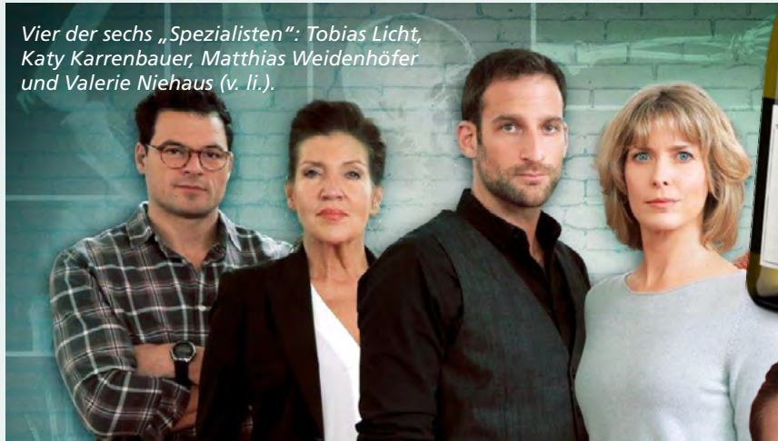
Vier der sechs „Spezialisten“: Tobias Licht, Katy Karrenbauer, Matthias Weidenhöfer und Valerie Niehaus (v. li.).

Dschungelcamp erinnert sie sich gerne zurück. „Im Vergleich mit den zehn Jahren ‚Hinter Gittern‘ war das ein Klacks. Das würde ich jederzeit wieder machen. Ich liebe Herausforderungen.“