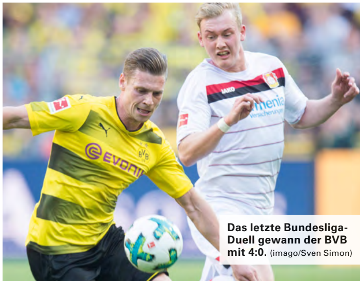
Das letzte Bundesliga-Duell gewann der BVB mit 4:0.