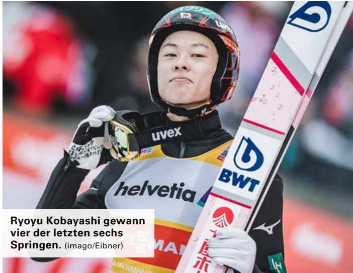
Ryoyu Kobayashi gewann vier der letzten sechs Springen.