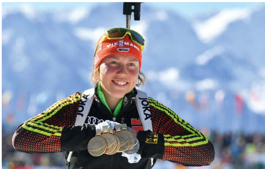
Fünfmal Gold, einmal Silber. Dieses Kunststück glückte Laura Dahlmeier bei der Biathlon-WM 2018. Wiederholung 2019 in Östersund?

Gemeinsam richten Deutschland und Dänemark die Handball-Weltmeisterschaft der Männer aus. Vom 10.-27. Januar kämpfen 24 Teams um die Medaillen. Deutsche Spielorte sind Berlin, München, Köln und Hamburg. Zwölf Jahre nach dem Wintermärchen mit dem Titelgewinn 2007 hofft die Nationalmannschaft vor eigenem Publikum wieder auf ein erfolgreiches Abschneiden. In der Vorrunde sind in Berlin Korea (10.1.), Brasilien (12.1.), Russland (14.1.), Top-Favorit Frankreich (15.1.) und Serbien (17.1.) die Gegner.