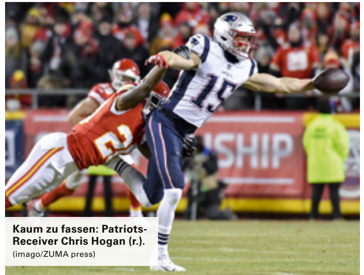
Kaum zu fassen: Patriots-Receiver Chris Hogan (r.).

Rams: Beim 53. Super Bowl, dem Playoff-Finale der NFL, ist das Team aus L.A. leichter Außenseiter. Doch das waren die defensivstarken Rams auch im Halbfinale in New Orleans – und gewannen (26:23 n.V.). Patriots: Quarterback-Legende Tom Brady (41) will mit seinen Pats den dritten Super Bowl in den letzten fünf Jahren. Die Stärken New Englands sind die große Erfahrung und die variable Offensive.