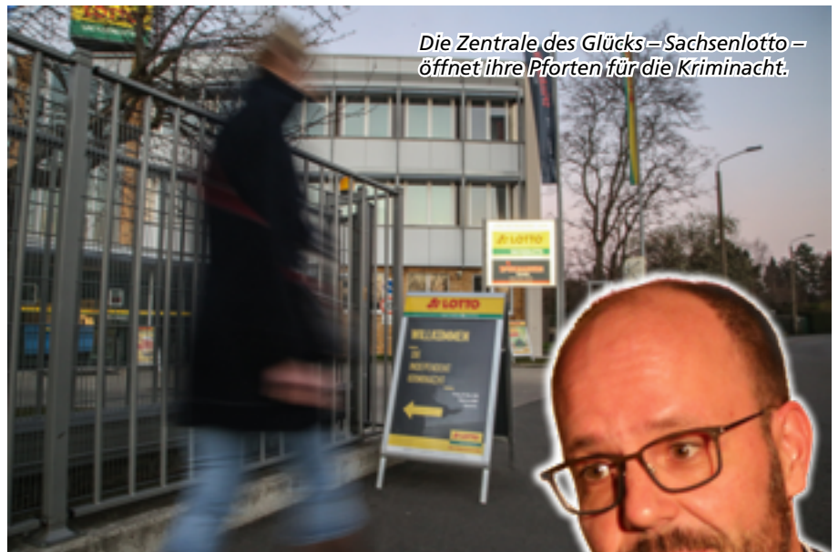
Die Zentrale des Glücks - Sachsenlotto - öffnet ihre Pforten für die Kriminacht.

Die sechs Autoren der Krimi-Thriller-und-Mystery-Lesenacht der unabhängigen Verlage brachten eine be-