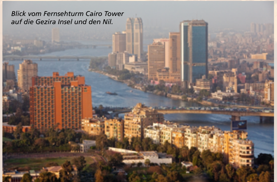
Blick vom Fernsehturm Cairo Tower auf die Gezira Insel und den Nil.

Landesfläche, ein Grünstreifen, zwischen fünf und 20 km breit. Hier wohnen auch die meisten der fast 100 Millionen Ägypter. Ausgenommen einiger weniger Oasen ist der Rest des Landes Wüste.