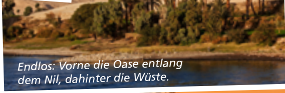
Endlos: Vorne die Oase entlang dem Nil, dahinter die Wüste.