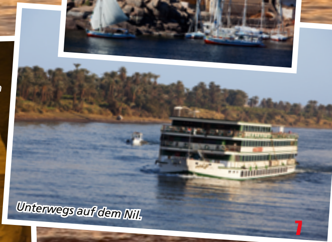
Unterwegs auf dem Nil.