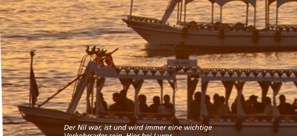
Der Nil war, ist und wird immer eine wichtige Verkehrsader sein. Hier bei Luxor.

6 Was die alten Ägypter mit ihren Hieroglyphen sagen wollten, bleibt bis heute in vielen Fällen rätselhaft.