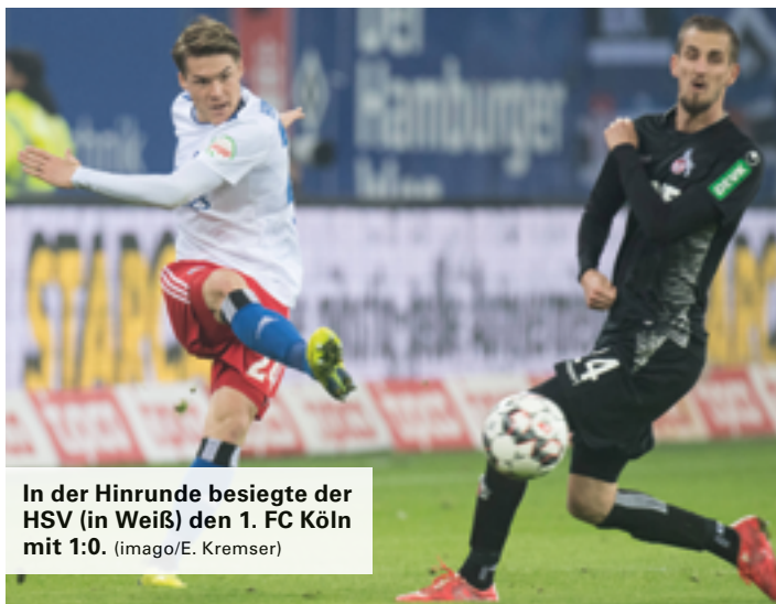
In der Hinrunde besiegte der HSV (in Weiß) den 1. FC Köln mit 1:0.