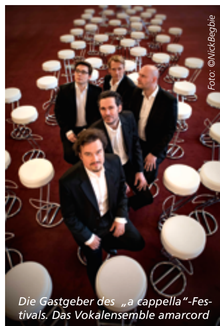
Die Gastgeber des „a cappella“-Festivals. Das Vokalensemble amarcord

ren Vokalensembles, noch nie allerdings beim Eröffnungskonzert. Nun geben amarcord ein Programm zusammen mit ihren Kollegen von Singer Pur. Das Sextett aus Regensburg (bestehend aus einer Sopranistin und fünf Männerstimmen) gehört wie amarcord zu den führenden Vokalensembles des Landes. Beide sind seit Anfang der 90er Jahre aktiv und aufgrund ihres großen Repertoires und ihres außerordentlichen Klangs weltweit gefragt. Im Eröffnungskonzert von „a cappella“ 2019 singen amarcord und Singer Pur einzeln, aber auch gemeinsam bis zu 11-stimmige Stücke aus der Zeit der Renaissance sowie der Gegenwart. Im Mittelpunkt des Abends stehen dabei Stücke des britischen Komponisten Ivan Moody, der für