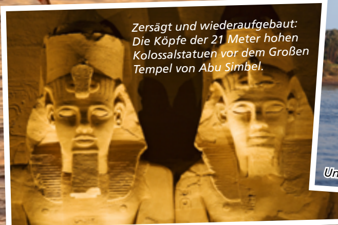
Zersägt und wiederaufgebaut: Die Köpfe der 21 Meter hohen Kolossalstatuen vor dem Großen Tempel von Abu Simbel.