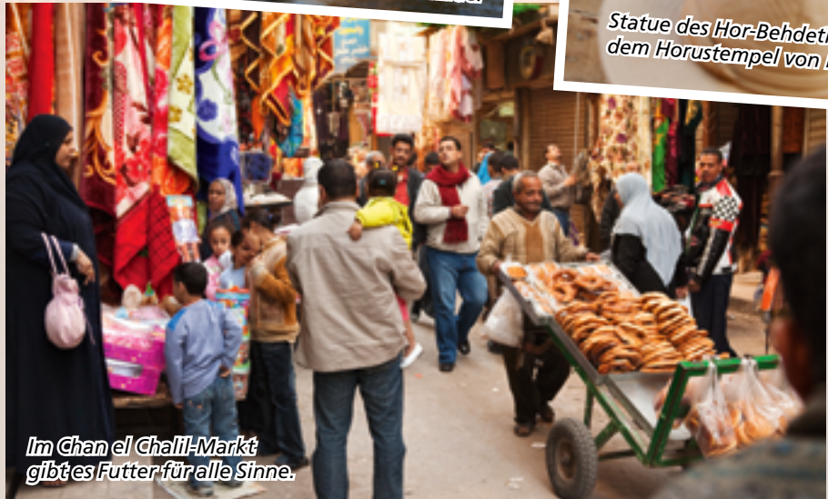
Im Chan el Chalil-Markt gibt's Futter für alle Sinne.

Hier bildet der Nil viele Arme. Auf einer der Inseln lässt sich ein nubisches Dorf besuchen. Am östlichen Ufer des Nils steht das Old Cataract Hotel. In ihm