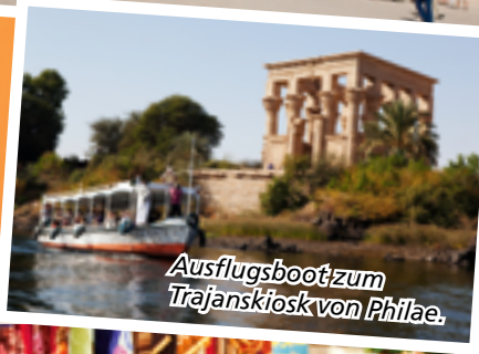
Ausflugsboot zum Trajanskiosk von Philae.