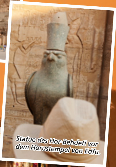
Statue des Hor-Behdeti vor dem Horustempel von Edfu.

te. Kaum irgendwo anders wurden alte Bauwerke so gut erhalten wie hier. Dem trockenen Wüstensand sei gedankt.