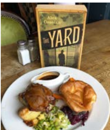
Eine typisch englische Mahlzeit im Restaurant gleich neben dem Museum.

Wie lange nun jeder auf dieser Route oder einer der anderen möglichen verbringt, um das Flair der 8,6 Millionen Einwohner zählenden Stadt samt unvergesslichen Eindrücken aufzu-