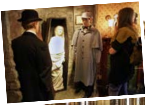
Die Wachsfiguren zeigen wichtige Romanhelden. Darunter für Groß und Klein immer wieder nur zum Stauen - das Naturhistorische Museum - Eintritt frei.