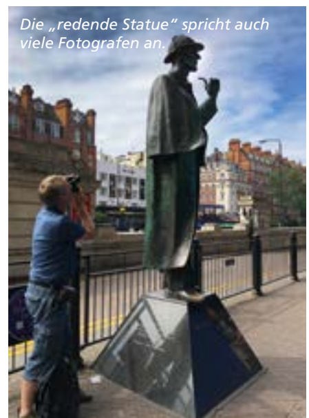
Die „redende Statue“ spricht auch viele Fotografen an.

Wie lange nun jeder auf dieser Route oder einer der anderen möglichen verbringt, um das Flair der 8,6 Millionen Einwohner zählenden Stadt samt unvergesslichen Eindrücken aufzu-