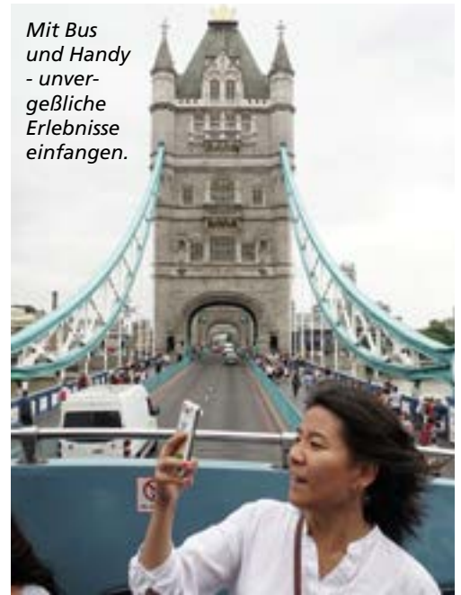
Mit Bus und Handy - unvergeßliche Erlebnisse einfangen.

ist. Das Gebäude mit der grünen Fassade erkennt jeder schon von weitem, weil hier - wie bei Madame Tussauds Wachsfigurenkabinett gleich um die Ecke - in den meisten Fällen eine lange Schlange wartender Touristen aus aller Herren Länder steht. Geduld ist also mit zu bringen oder besser noch, man hat einen der spannenden und die Wartezeit verkürzenden Roman von Arthur Conan Doyle dabei. Den gibt es in dem wundervollen Souvenirshop, wo auch die Eintrittskarte für 15 Pfund zu lösen ist. Steht man dann kurz vor dem „Bobby“, der den Eingang nicht nur bewacht, sondern zigtausende Mal mit den Besuchern fotografiert wurde, ist es gleich soweit.