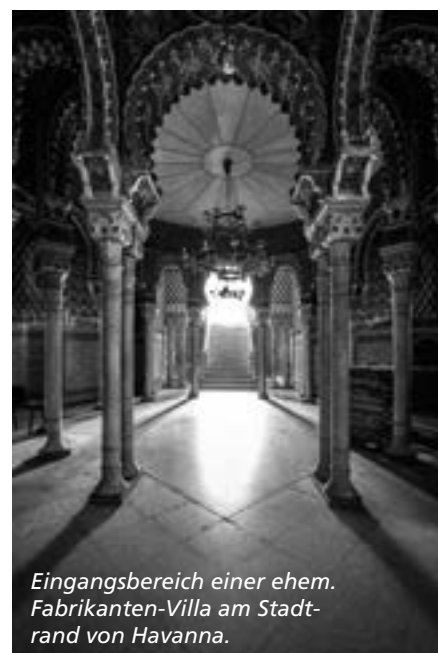
Eingangsbereich einer ehem. Fabrikanten-Villa am Stadt- rand von Havanna.

Wer Hemingways Kuba noch erleben will, muss sich beeilen, meint Sünderwald. Die anhaltende Popularität als Reiseziel, die das Land zurzeit erlebt, wird es nachhaltig verändern bzw. angleichen an das stereotype Erscheinungsbild zig anderer karibischer Urlaubsorte, die man fast beliebig gegeneinander austauschen kann. Noch ist Kuba eine Möglichkeit, Urlaub tatsächlich etwas anders zu machen – etwas Einzigartiges zu erleben. Noch!