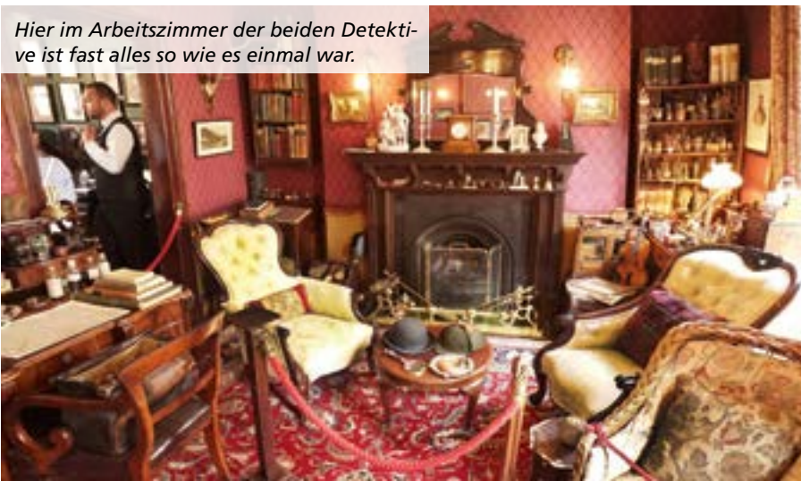
Hier im Arbeitszimmer der beiden Detektive ist fast alles so wie es einmal war.

Der nächste Halt – wie könnte es anders sein – an der U-Bahnstation Baker Street. Denn hier ist in den Bahnhofshallen nicht nur ein überdimensionales Konterfei von Sherlock zu finden, sondern steht am Ausgang eine drei Meter hohe sprechende Statue des Detektivs und verweist auf das Haus 221 B, weil hier sein berühmtes Museum zu finden