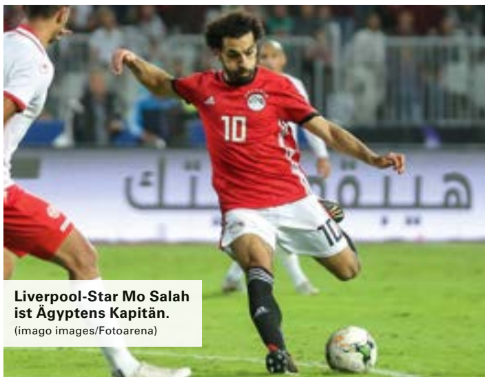
Liverpool-Star Mo Salah ist Ägyptens Kapitän.