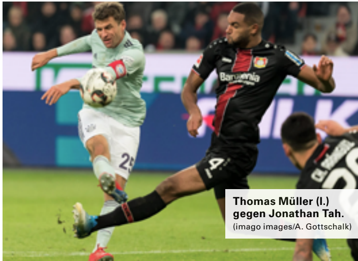
Thomas Müller (l.) gegen Jonathan Tah.