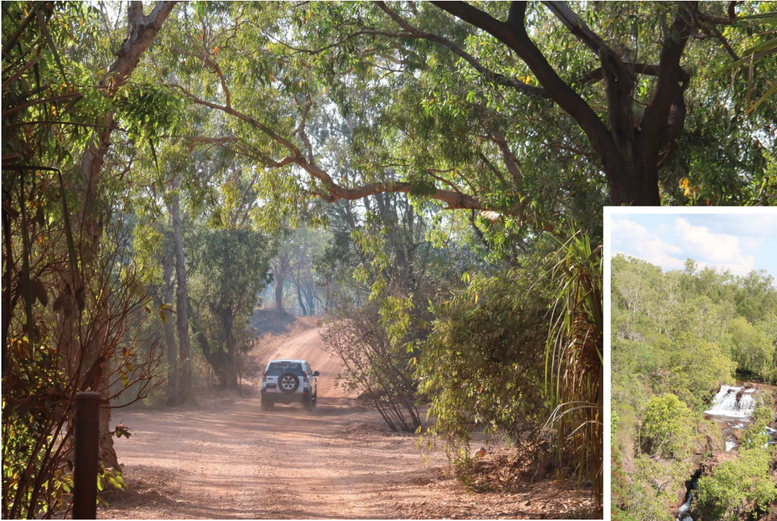
Auf dem Weg zum Litchfield Nationalpark – der populäre Park ist vergleichsweise leicht zugänglich, dennoch ist ein Allradfahrzeug empfehlenswert.

kodil-Check gemacht. Dafür werden Futter und Gegenstände für einen Bissstest ausgelegt“, berichtet Nifty. Erst wenn sichergestellt ist, dass sich kein Krokodil im Wasser und in dessen Umgebung befindet, wird das Baden freigegeben.