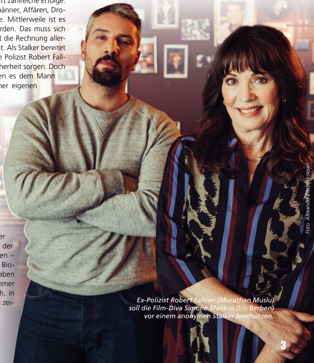
Ex-Polizist Robert Fallner (Murathan Muslu) soll die Film-Diva Simone Mankus (Iris Berben) vor einem anonymen Stalker beschützen.