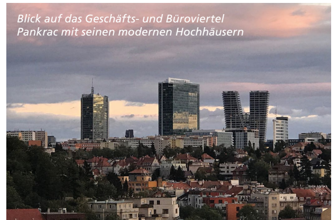
Blick auf das Geschäfts- und Büroviertel Pankrac mit seinen modernen Hochhäusern

Die Bilder gingen damals um die Welt und bewegen noch heute viele Menschen, wenn diese zum Beispiel in Reportagen gezeigt werden. Mehr als 30 Jahre nach diesen dramatischen Ereignissen hat sich auch Prag stark verändert. Es ist bunter, moderner und weltoffener geworden. Jetzt, im Herbst, ist eine ideale Zeit, die Stadt und ihre Schönheiten auch abseits der ausgetretenen Pfade zu entdecken. Ab Dresden dauert eine Zugfahrt reichliche zwei Stunden. Auch die Autobahn A 17 bringt Touristen schnell in die wunderschöne Stadt. Das glüXmagazin hat einige Prag-Tipps.