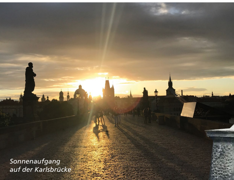
Sonnenaufgang auf der Karlsbrücke

Gar nicht weit weg, ist der Havlíček Park mit der Villa Gröbe und einem etwas abseits gelegenen Geheimtipp: Die wunderschöne Grotte in der nordwestlichen Ecke des Parks besteht aus