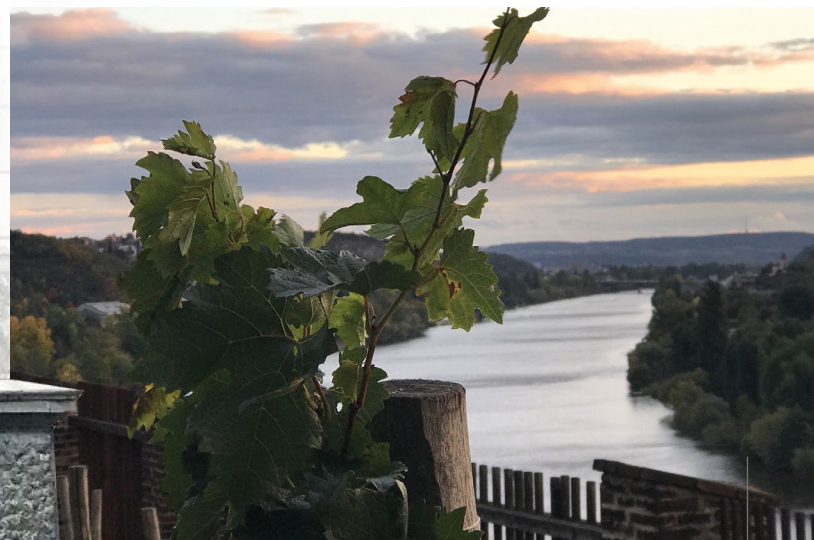
Blick über den Weinberg von Burg Vyšehrad über die Moldau