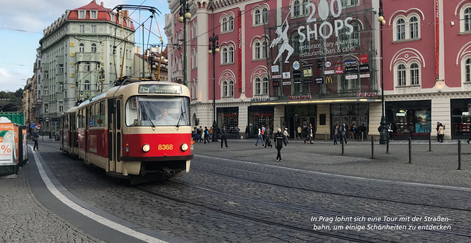
In Prag lohnt sich eine Tour mit der Straßenbahn, um einige Schönheiten zu entdecken

mehreren Höhlen und steinernen Sitznischen. Abseits des Prager Trubels ein schöner Ort, um beim Plätschern des Brunnens zu entspannen.