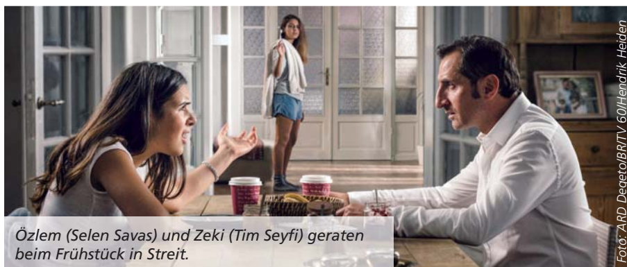
Özlem (Selen Savas) und Zeki (Tim Seyfi) geraten beim Frühstück in Streit.

Das Interview führte Iris-Vanessa Voltmann