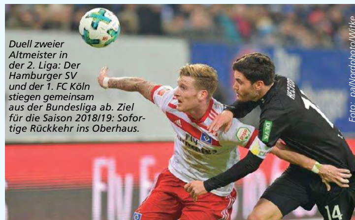
Duell zweier Altmeister in der 2. Liga: Der Hamburger SV und der 1. FC Köln stiegen gemeinsam aus der Bundesliga ab. Ziel für die Saison 2018/19: Sofortige Rückkehr ins Oberhaus.

Rückrunde: 15.-18.03.2019 1. FC Magdeburg SV Darmstadt 98 Erzgebirge Aue 1. FC Union Berlin FC Ingolstadt 04 FC St. Pauli 1. FC Köln Greuther Fürth VfL Bochum Dynamo Dresden Hamburger SV Holstein Kiel 1. FC Heidenheim SC Paderborn 07 SV Sandhausen MSV Duisburg Jahn Regensburg Arminia Bielefeld