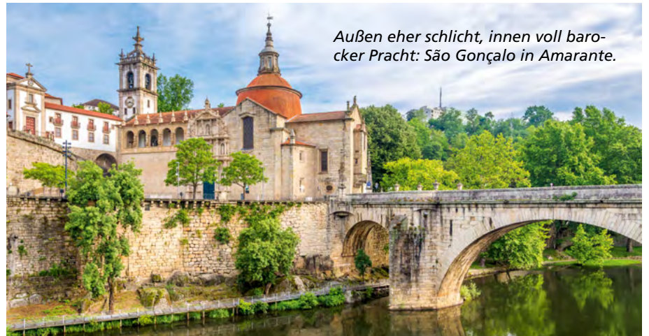
Außen eher schlicht, innen voll barocker Pracht: São Gonçalo in Amarante.

Die Basilika Santuário de Santa Luzia hoch über Viana do Castelo.